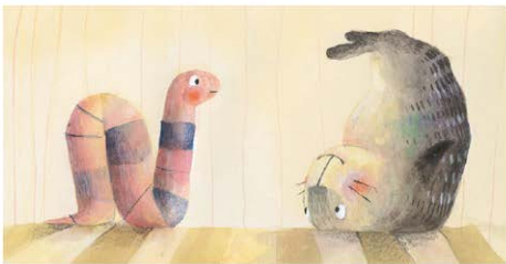
—Quan això no funciona —continua la foca Rosa—, passem al segon pas: mirar el teu voltant de cap per avall.