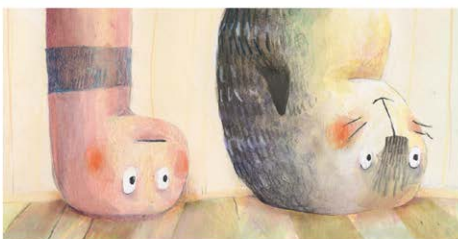
El cuc Walter no entén de què serveix estar del revés. Comença a dubtar de l'efectivitat del pla de la foca Rosa i exclama: —Així no trobaré mai la meua gorra!