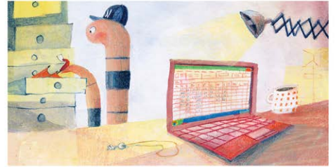
L'oficina obre de dilluns a divendres, des que surt el sol fins que es pon.