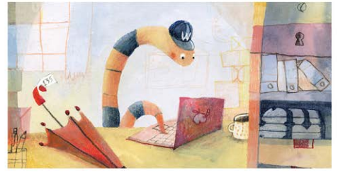
El cuc Walter té una oficina d'objectes perduts. Quan algú perd alguna cosa, ho pot trobar a la seva oficina.