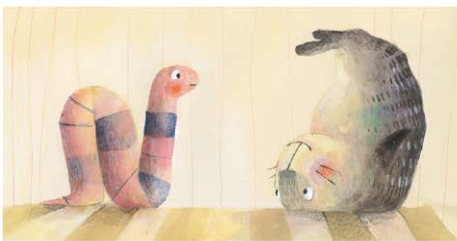
—Cuando eso no funciona— dice Rosa—, pasamos a la fase dos: mirar desde otra perspectiva.

La oficina de objetos perdidos es una de las mejores del mundo. Todo lo que llega, se ordena y se archiva enseguida. Hay mucho trabajo, porque los otros animales son muy despistados y siempre pierden sus cosas. Pero el gusano Walter no necesita ni dos segundos para rebuscar entre sus estantes y encontrar lo que buscan.