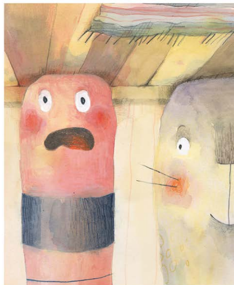
El gusano Marco recupera la tercera fase. —Todavía queda la tercera fase. Estas siempre funcionan.