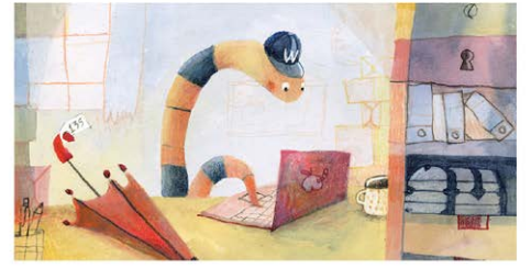
El gusano Walter tiene una oficina de objetos perdidos. Cuando alguien pierde algo, lo puede encontrar en su oficina.