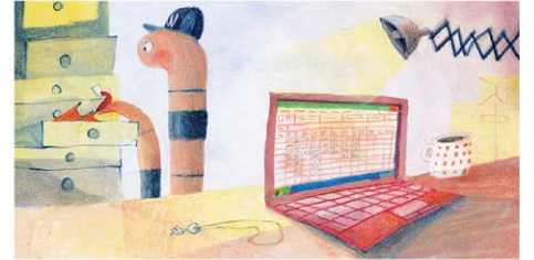
La oficina está abierta de lunes a viernes, desde que sale el sol hasta que se pone.