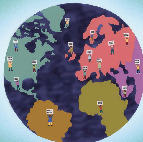
Los estudiantes empezaron a hacer huelga por todo el mundo. Si los adultos no actuaban para salvar el planeta, lo harían ellos.