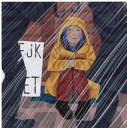
Todos los viernes, Greta iba al edificio del Parlamento, aunque lloviera.