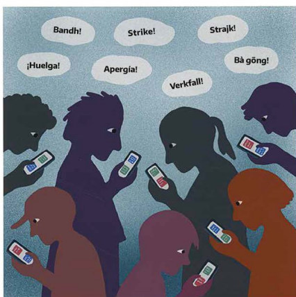
La gente comenzó a fijarse en los jóvenes huelguistas. Y la noticia sobre la huelga escolar de los viernes se expandió por el ciberespacio.